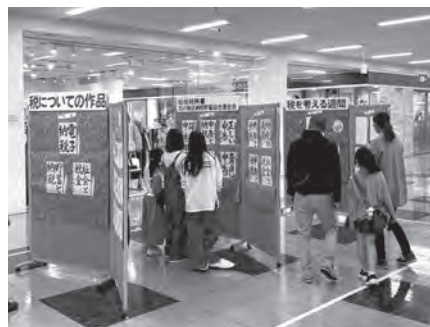
作品展で「何て上手なの!!」

表彰式』に先立って、松任税務署と石川地区納税貯蓄組合連合会の共催による令和6年度『合同納税表彰式』が行われ、申告納税制度の普及などに貢献した8氏1団体の功績を称えました。 *受賞者の氏名等は、第238号（令和6年11月1日発行）第1面に掲載 『税についての作品』を展示 今年度の各部門の金賞・銀賞・銅賞の入賞作品は、「税を考える週間」の期間中に、白山市のアピタ松任店で展示され、多くの方に観覧いただきました。