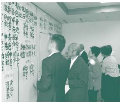
9月26日、松任税務署にて熱心に力作を審査しました

【問い合わせ】 石川税務連絡協議会 公益社団法人松任法人会 TEL274-3157