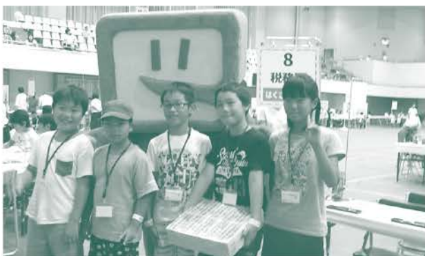
“1億円?”を抱える子どもたち 法人会青年部会も協力 ＝松任総合運動公園体育館