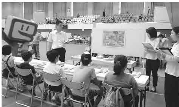
税務職員体験ブースにて、税の仕組みを学ぶ児童たち =松任総合運動公園体育館