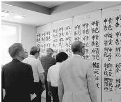
9月26日、松任税務署にて熱心に力作を審査しました

入場無料 どなたでも聴講できます 【問い合わせ】 石川税務連絡協議会 公益社団法人松任法人会 TEL274-3157