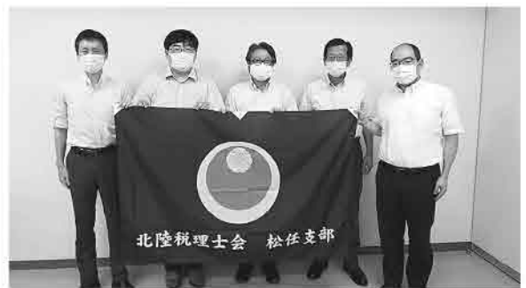
総会で、新調した支部の旗とともに(税理士会)

事業方針として、景気悪化の中、情報収集や研修を通じて中小企業に真に効果のある対策を実行していくよう努めること、業務内容が大きく変化しつつある状況に全ての会員が対応できるように努めること、などを決定しました。