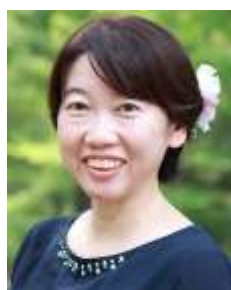
小野税務会計事務所 所長 税理士